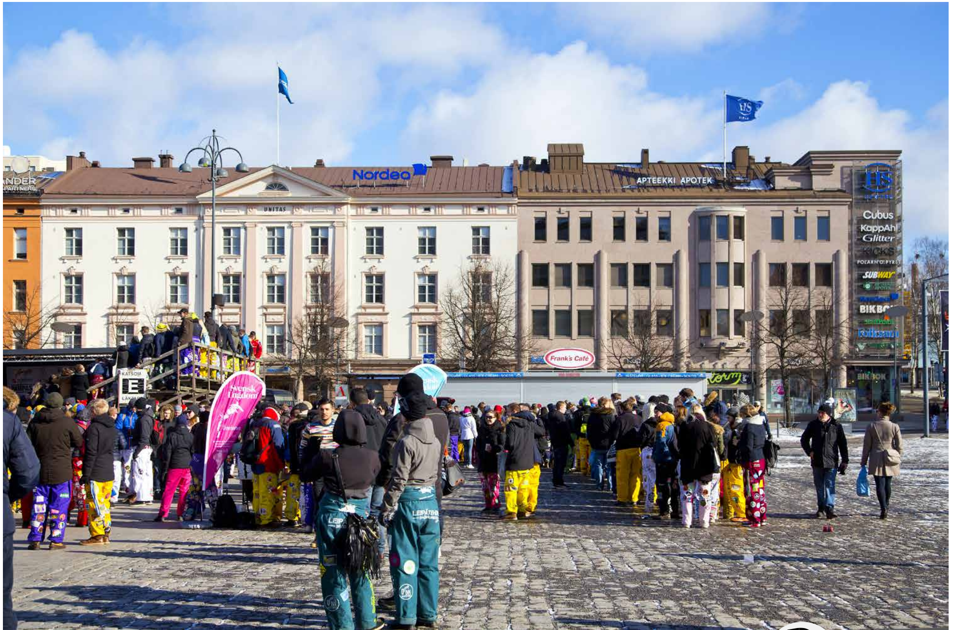
HS Center