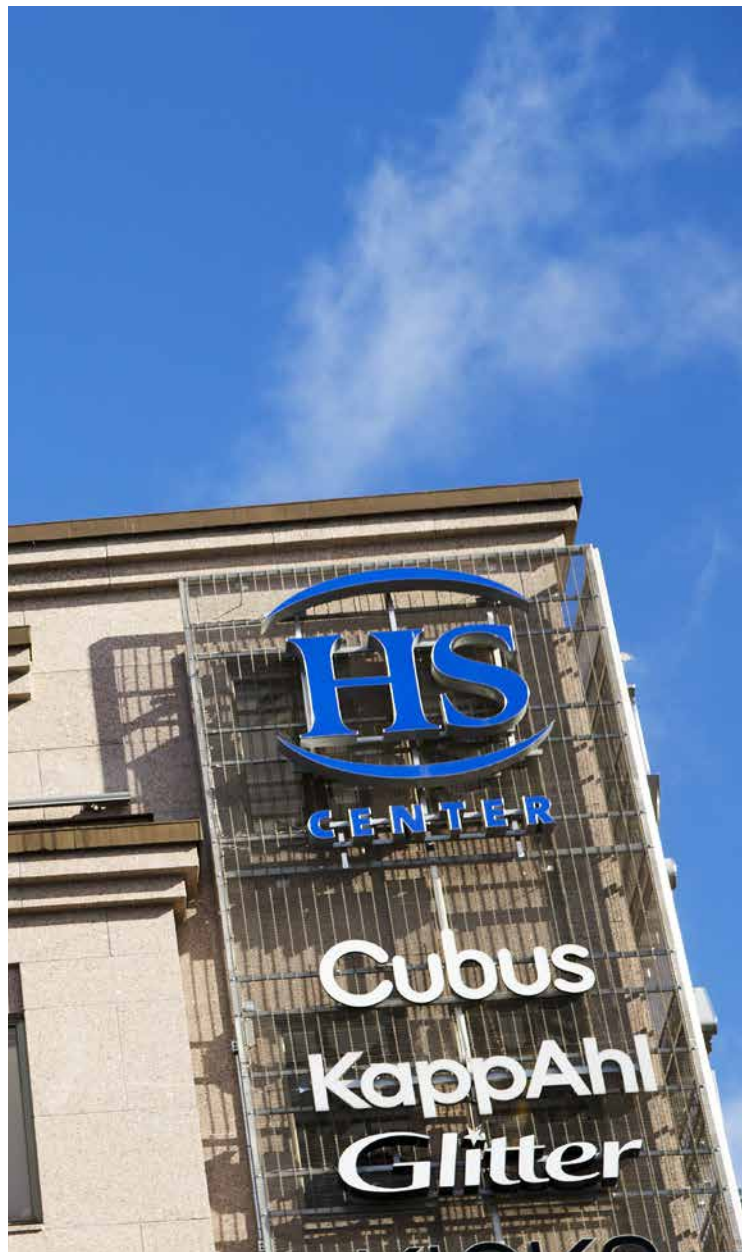
FAB Vasa Unitas